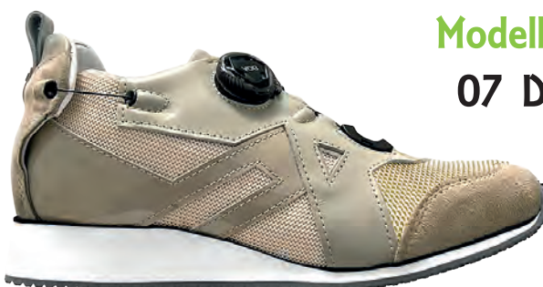
Modello 07 D