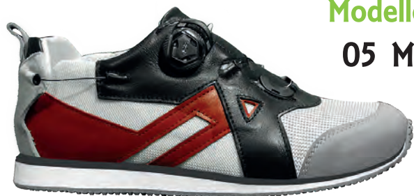
Modello 05 M

Calzature PREDISPOSTE per Plantare. PER TUTORE = PRODUZIONE SU MISURA