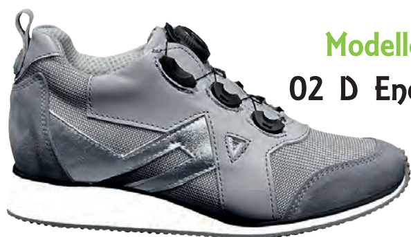
Modello 02 D Energy