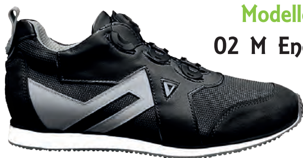
Modello 02 M Energy