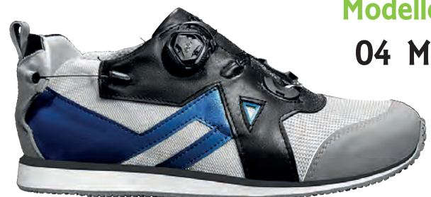
Modello 04 M