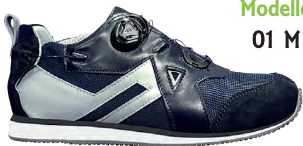
Modello 01 M

Calzature PREDISPOSTE per Plantare. PER TUTORE = PRODUZIONE SU MISURA