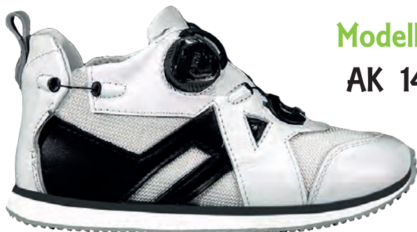
Modello AK 14