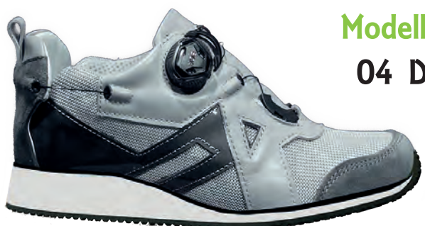
Modello 04 D