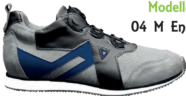
Modello 04 M Energy