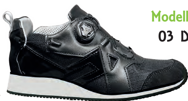
Modello 03 D