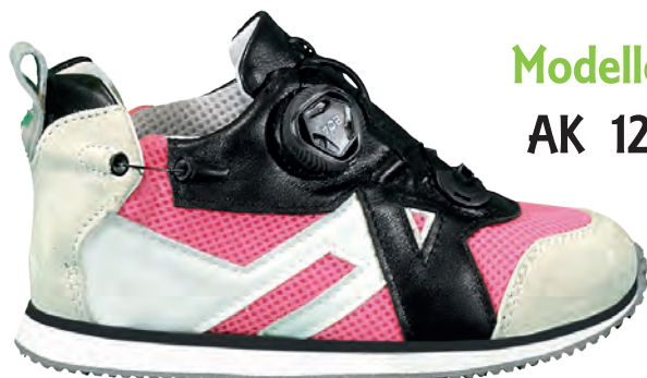
Modello AK 12