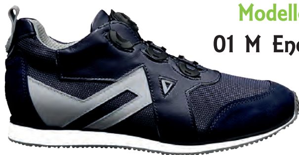
Modello 01 M Energy

Calzature PREDISPOSTE per Plantare. SENZA SPOILER