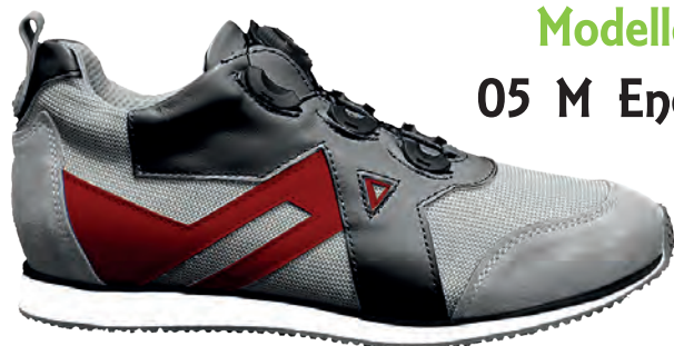
Modello 05 M Energy

Calzature PREDISPOSTE per Plantare. SENZA SPOILER