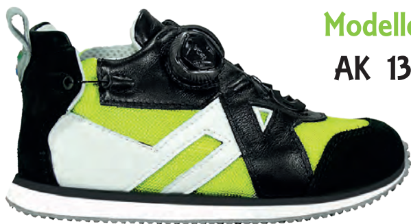
Modello AK 13