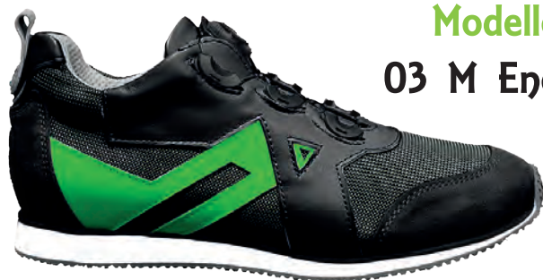
Modello 03 M Energy