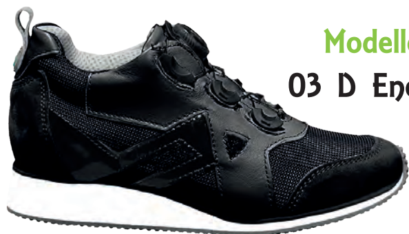
Modello 03 D Energy