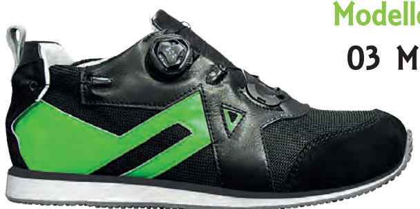
Modello 03 M