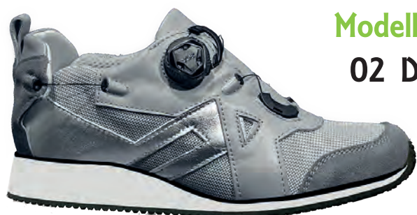
Modello 02 D