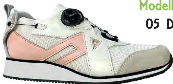
Modello 05 D

Calzature PREDISPOSTE per Plantare. PER TUTORE = PRODUZIONE SU MISURA