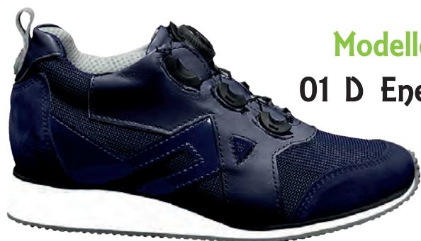
Modello 01 D Energy

Calzature PREDISPOSTE per Plantare. SENZA SPOILER