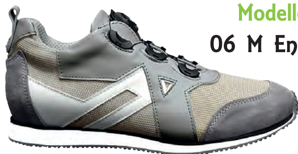
Modello 06 M Energy