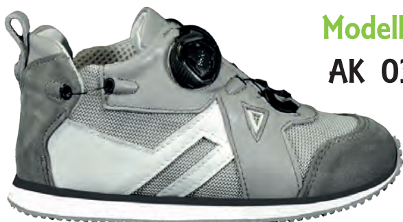
Modello AK 03