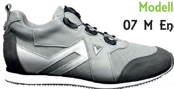
Modello 07 M Energy