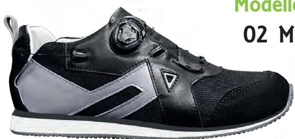
Modello 02 M