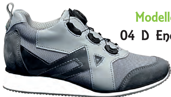
Modello 04 D Energy