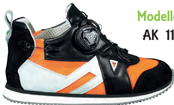
Modello AK 11