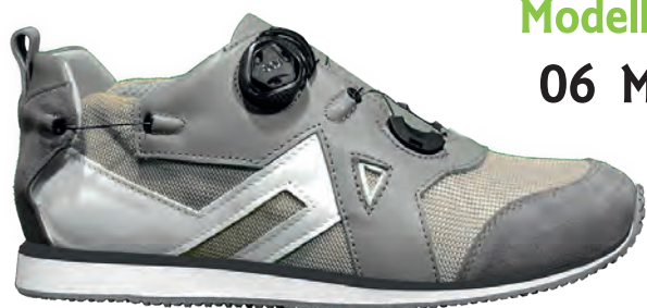
Modello 06 M