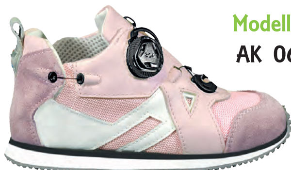
Modello AK 06

TAGLIE dal 20 al 47 COLORE BEIGE / BIANCO FODERA Vitello BIANCO Air Mash Grigio Perla SUOLA Micro Zeppa FLEXI Tacco Smussato