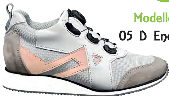
Modello 05 D Energy

Calzature PREDISPOSTE per Plantare. PER TUTORE = PRODUZIONE SU MISURA