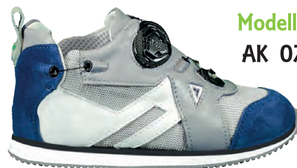
Modello AK 07

TAGLIE dal 20 al 47 COLORE ROSA / BIANCO FODERA Vitello BIANCO Air Mash Grigio Perla SUOLA Micro Zeppa FLEXI Tacco Smussato