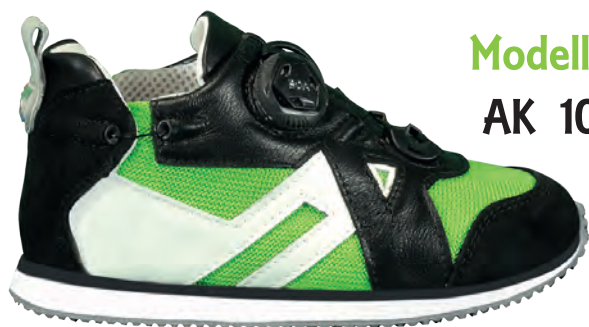
Modello AK 10