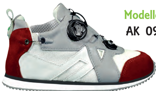
Modello AK 09