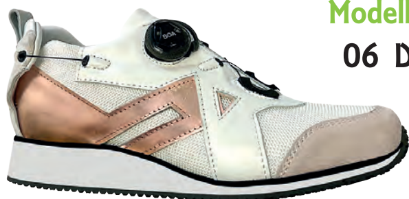
Modello 06 D