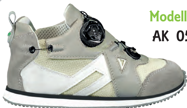
Modello AK 05