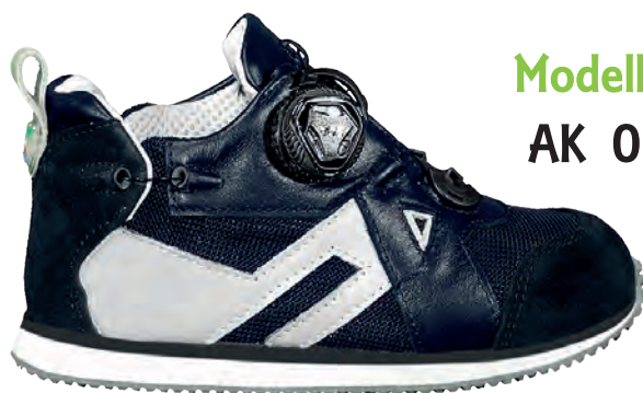
Modello AK 01