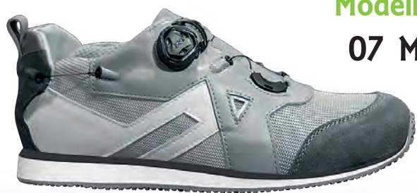
Modello 07 M