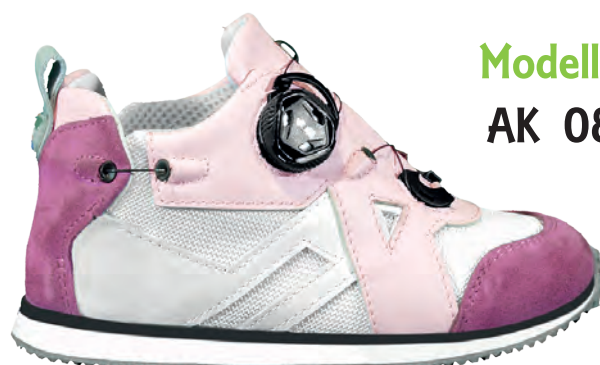
Modello AK 08

TAGLIE dal 20 al 47 COLORE BLU / GRIGIO / BIANCO FODERA Vitello BIANCO Air Mash Grigio Perla SUOLA Micro Zeppa FLEXI Tacco Smussato