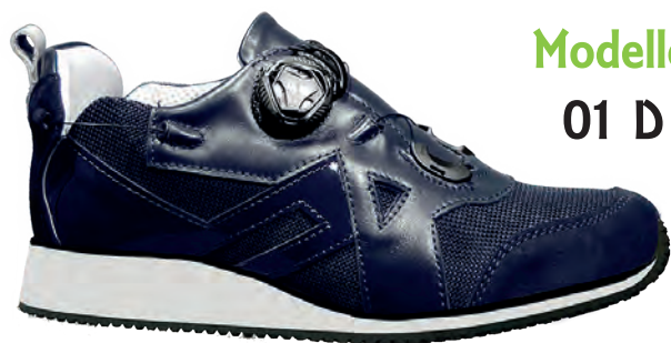
Modello 01 D

Calzature PREDISPOSTE per Plantare. PER TUTORE = PRODUZIONE SU MISURA