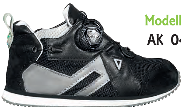
Modello AK 04