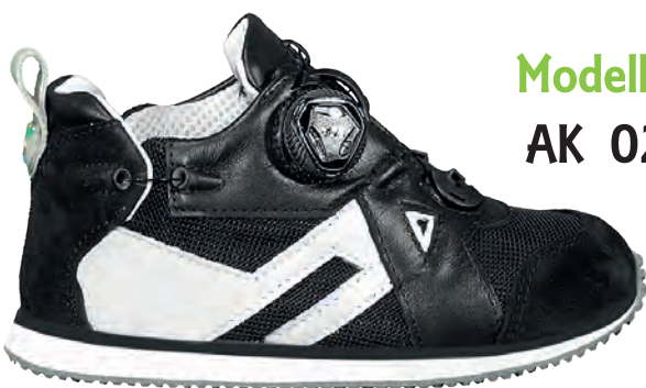
Modello AK 02