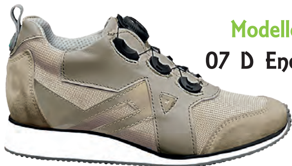
Modello 07 D Energy