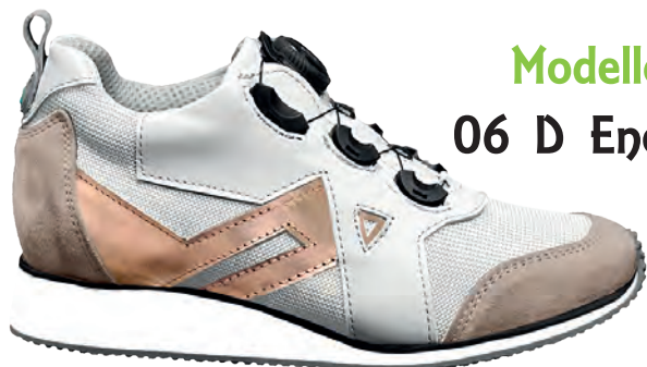
Modello 06 D Energy